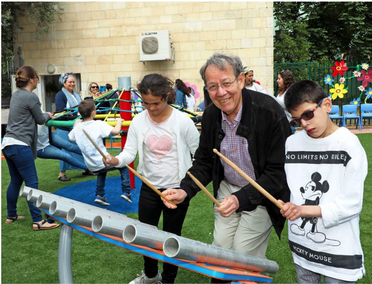
Spiel und Spass im neu eröffneten sensorischen Garten. Möglich wurde sein Bau dank der Schweizer Simon-und-Hildegard-Rothschild-Stiftung.