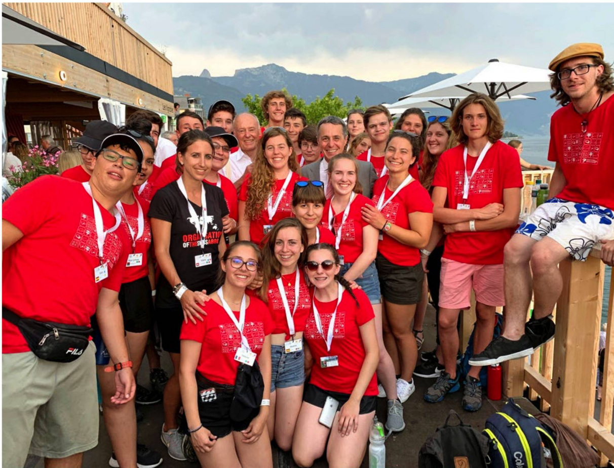
Jugendliche Lager- teilnehmende treffen Bundesrat Cassis an der Fête des Vignerons.