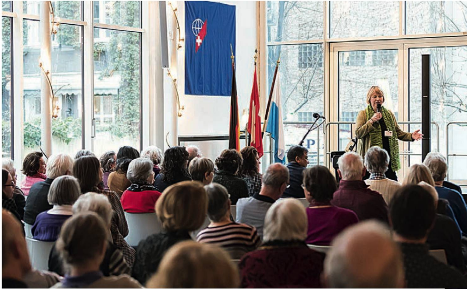
Präsidentin Adelheid Wälti begrüsst zahlreiche Gäste im Schweizerhaus (o).