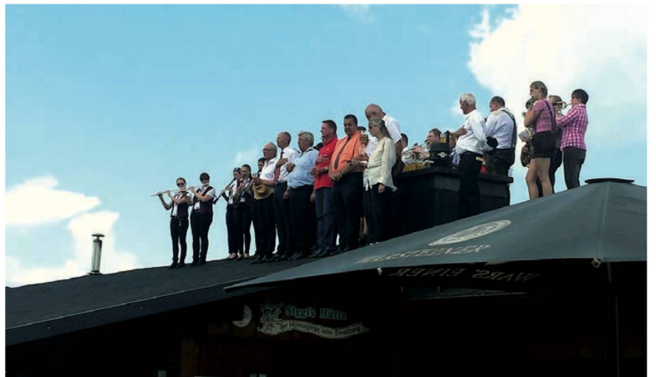
Oben: Ökumenischer Berggottesdienst Wenn aus tausenden Kehlen die Melodien bekannter Kirchenlieder aufsteigen und der Blick über das herrliche Bergpanorama schweift, fühlt man sich angeblich dem Himmel nah.

■ Kleine Augustfeier am 1. August um 18 Uhr: Die Mitglieder des Schweizer Clubs Kassel treffen sich mehrmals im Jahr zum entspannten und interessanten Gedankenaustausch im «Matterhornstübli» bei Fendant, Dôle und weiteren kulinarischen Köstlichkeiten wie Fondue, Raclette, Rösti und damit vergehen die Stunden wie im Flug.