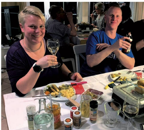
Ein Glas Wein darf beim Raclette nicht fehlen.

Wir fanden uns mit vierzehn Personen zu diesem Raclette-Essen ein, und es war eine sehr gemütliche Runde. Es gab leckeren Käse, den die Schwendener aus ihrem Heimatort Grindelwald mitgebracht hatten, Kartoffeln sowie diverse Zutaten.