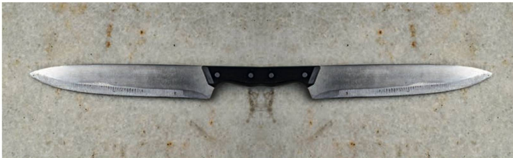
«alas peligrosas» titelt sich dieses Werk. Cette œuvre est intitulée «alas peligrosas». © Daniel Garbade