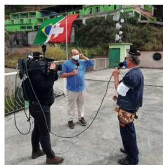
Entrevista à distância

A antiga Fazenda do Morro Queimado enfeitada de vermelho e branco