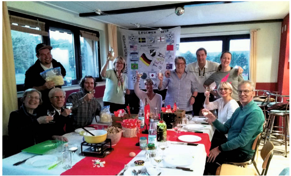
Ausgelassene Stimmung vor Corona: Beim Aachener Fondue-Abend bekam jede Vierergruppe einen Korb mit allen Zutaten. Zubereiten mussten diese ihr Fondue selber.

Dennoch wuchs der Wunsch in unseren Herzen trotz der aktuellen Lage eine gemeinsame Augustfeier durchzuführen. Die Planungen standen immer unter dem Damoklesschwert, ob die Entwicklung der Pandemie dies überhaupt zulassen würde. Alle vier-