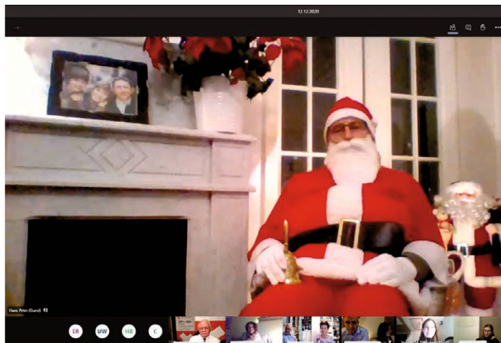
Aus dem Generalkonsulat Frankfurt hatte sich der Nikolaus persönlich zugeschaltet.