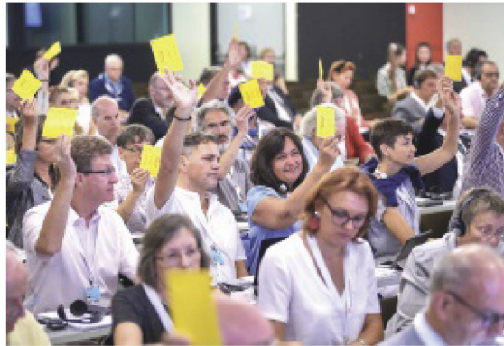
Das Parlament der 5. Schweiz - le parlement de la 5ème Suisse