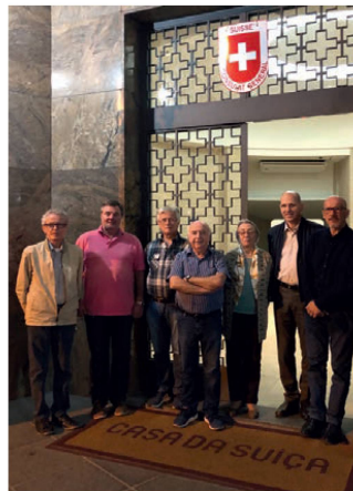
Membros da Diretoria

Associação Filantrópica Suíça Rua Cândido Mendes 157 – Térreo Glória – 20241-220 Rio de Janeiro Filantropica.rj@gmail.com www.filantropicasuica.org.br