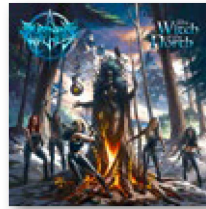
BURNING WITCHES: «The Witch Of The North». Nuclear Blast, 2021

Sie haben das Genre nicht eben neu erfunden. Im Gegenteil, die Burning Witches stehen für einen konsequent traditionellen, um nicht zu sagen altmodischen Heavy Metal. Aber die Schweizerinnen haben das gewisse Etwas. Zum einen sind sie eine reine Frauenband, was im Metal nach wie vor Seltenheitswert hat und entsprechend Aufmerksamkeit erregt. Und sie vermarkten sich äusserst clever. Die Musikerinnen inszenieren sich als zeitlose Fantasy-Heldinnen, als Kriegerinnen oder Hexen, als starke Frauen, die nicht nur schön sind, sondern ebenso gefährlich.