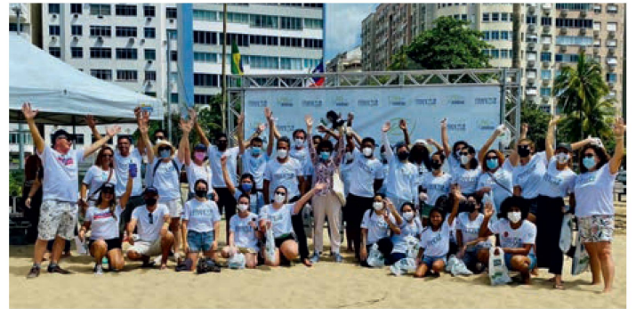
Francecolab na praia de Copacabana

Estar em um ambiente rodeado de jovens com ideias brilhantes