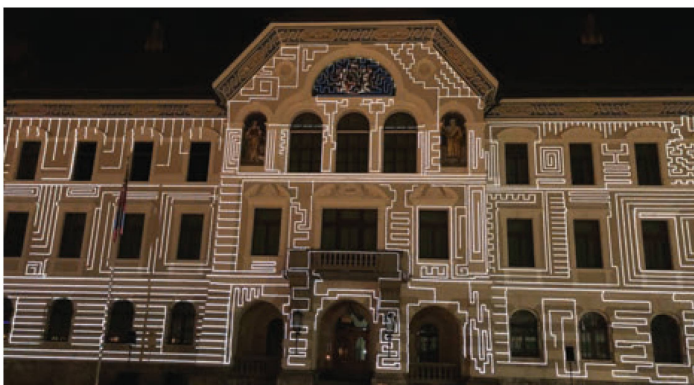
Structure in Motion