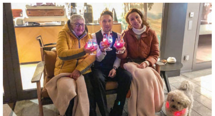
Selbst die Getränke wurden zu einem leuchtenden Erlebnis.