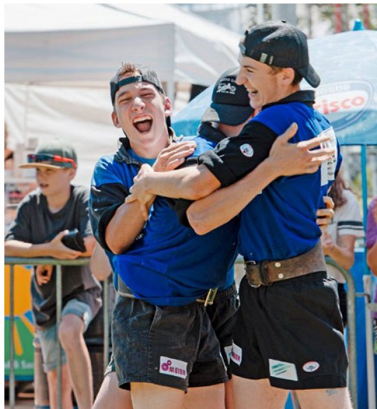
«Cooler Teamsport»: Junge Seilzieh-Asse vor und nach einem Zug (Bilder links und rechts).