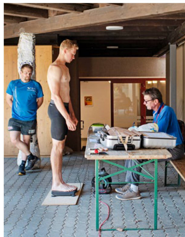
Das Mannschaftsgewicht muss stimmen und wird vor dem Wettkampf bei allen kontrolliert.