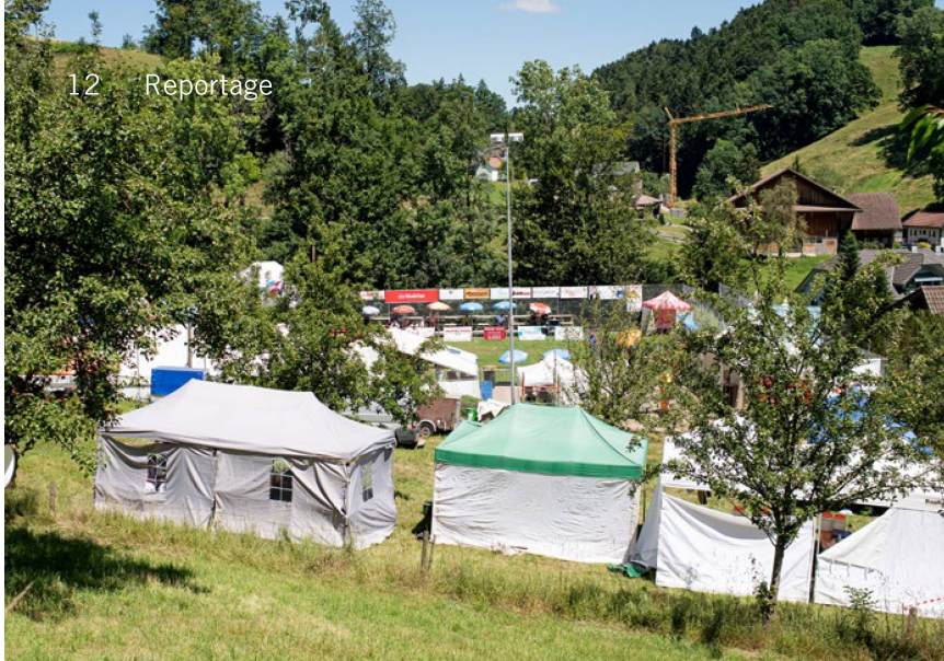
Von Zelten gesäumte Arena Ebersecken im Luzerner Hinterland (Bild links): endlich wieder Seilziehfest.