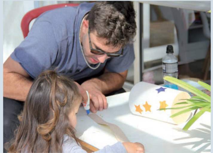
Criando as lanternas

ALUNA DO ENSINO MÉDIO E INTEGRANTE DO CAS