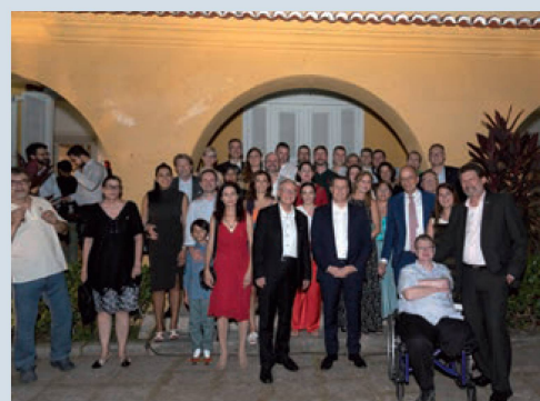
O time da Suíça no Brasil