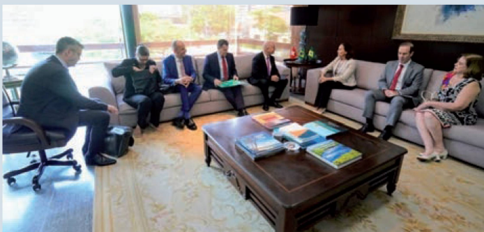
Delegação suíça com a governadora