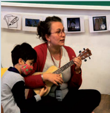
Aula do projeto MiDU

Canções são um recurso importante para a aquisição de uma língua estrangeira. A música tem um papel ativo no desenvolvimento integral das crianças: intelectual, auditivo, sensorial e motor.