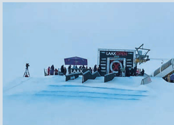
Das Starthaus der Laax Open ist bereit für die Teilnehmenden