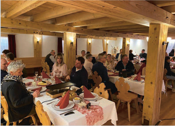
Ein gemütlicher Abend in stimmungsvollem Ambiente

Um 18.30 Uhr traf man sich im schön dekorierten und vorbereiteten Veranstaltungsraum im Bangshof Ruggell. Der Abend fand unter dem Motto «Nacht in Tracht» statt und dementsprechend hatten sich fast alle Anwesenden in Dirndl oder Tracht schön gemacht, um dem Motto gerecht zu werden. Ebenfalls gab es für die passend gekleideten Teilnehmer einen Preisnachlass bei den Kosten für das Raclette.