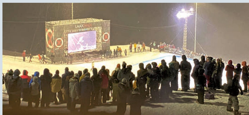
Auf der Videoleinwand sahen die Zuschauer den gesamten Lauf der Teilnehmenden