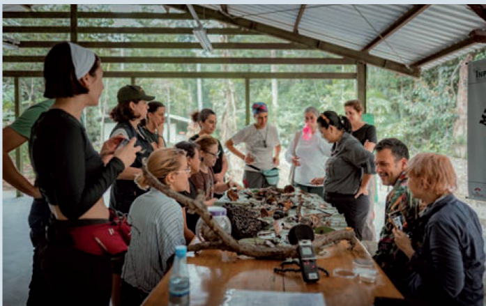
Grupo dos participantes do projeto

Como o reino dos cogumelos pode nos ensinar novas formas de viver no mundo? Para estimular reflexões sobre arte e ciência, a Swissnex no Brasil, em colaboração com a Pro Helvetia, apoiam o projeto Fungi Cosmology, cocriado pela LabVerde e Casa Museo Alberto Baeriswyl. Fungos, ou cogumelos, são mestres decompositores que mantêm florestas vivas, decompondo matéria orgânica e liberando nutrientes no meio ambiente, a teia que conecta organismos vivos de todos os ecossistemas. Sob cada floresta, existe uma rede subterrânea complexa e colaborativa de raízes e fungos conectando árvores e plantas entre si, a Wood Wide Web.