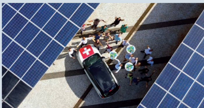
Equipe da Embaixada com painéis solares

A sustentabilidade é um tema central para a política interna e externa suíça. O Brasil é considerado um país chave em questões ambientais e de sustentabilidade, possuindo dois terços da floresta amazônica, a maior biodiversidade e a maior reserva de água doce do mundo. Neste cenário, a Suíça se engaja no país em ações multilaterais, projetos que fomentam a sustentabilidade, cooperação com a comunidade diplomática, além de ser pioneira em iniciativas para a preservação do meio ambiente.