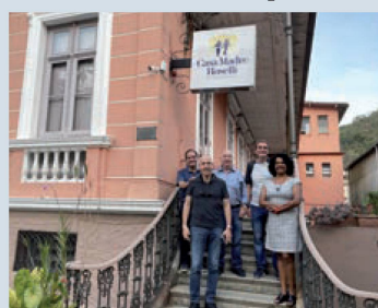
Visita à Casa Madre Roselli

Para continuar prestando auxílio e solidariedade em várias frentes, a AFS está sempre buscando novos associados e apoiadores