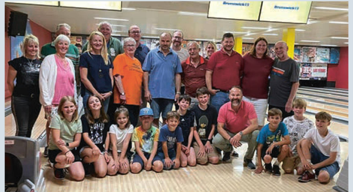
Die Teilnehmenden hatten sichtlich viel Spass