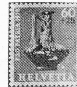
Garrafa de vidrio

Servicio filatélico DG PTT, CH-3000 Berna