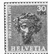
Cabeza de una estatuita de Baco