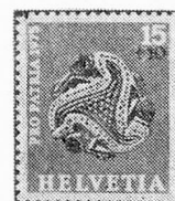
Broche de oro