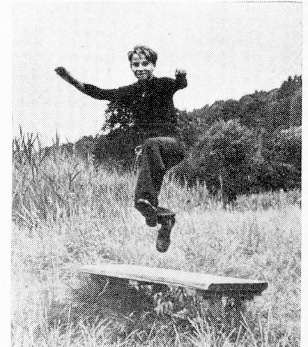
No conoce obstáculos

Por niño: Fr. 12.— pagadero al inscribirse.