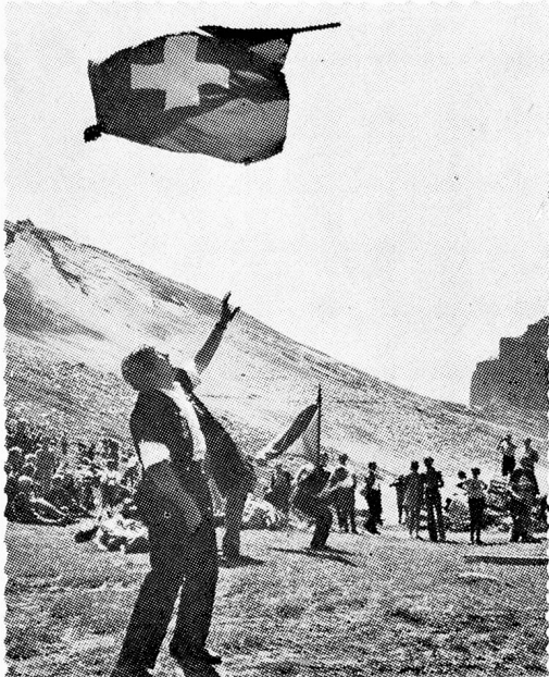
Greetings from Switzerland.