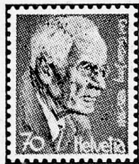
Carl Gustav Jung 1875-1961 Psychologe Psychologue Psicologo