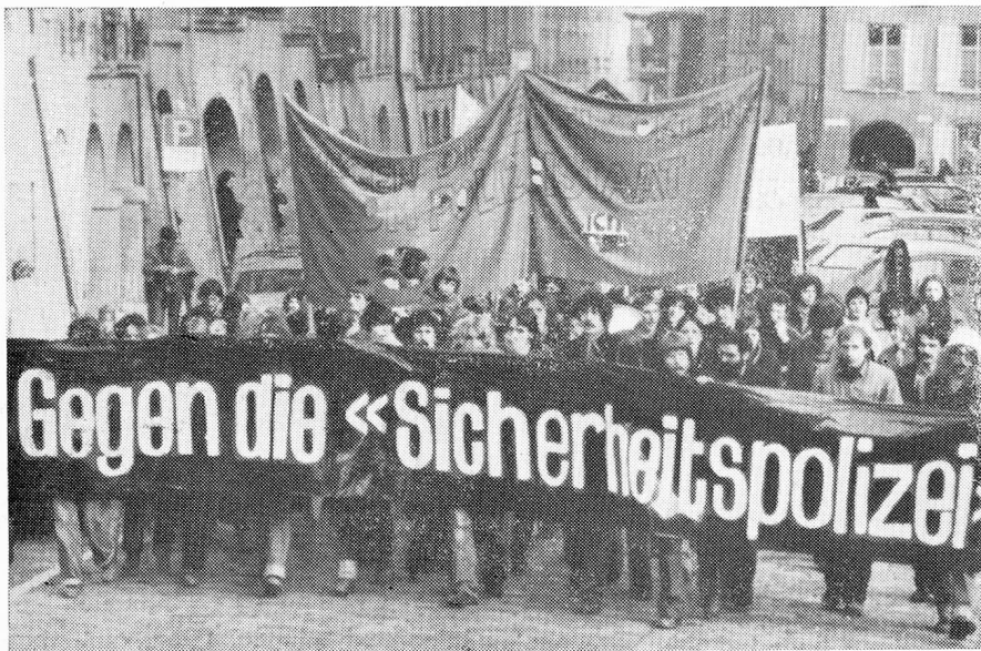
Muchas opiniones divergentes provocó la votación sobre una policía de seguridad. El pueblo rechazó el proyecto.