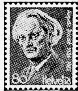
Auguste Piccard 1884-1962 Physiker Physicien Físico