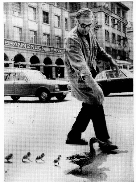
Deseamos que todos nuestros lectores hayan pasado sin contratarnos al nuevo año 1979, tal como esta familia de patos en las riberas del Limmat.