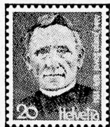
Abbé Joseph Bovet 1879-1951 Komponist Compositeur Musicista

Ausgabetag Jour d'émission 14 9 1978 Giorno d'emissione