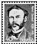
Henri Dunant 1828-1910 Philanthrop Philanthrope Filantropo