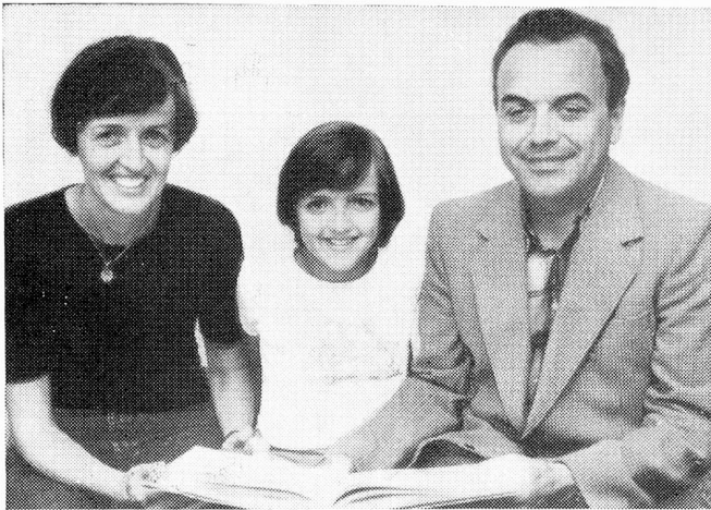
El profesor e investigador basileño Werner Arber obtiene el premio Nobel en Medicina. Aquí con su esposa e hija.