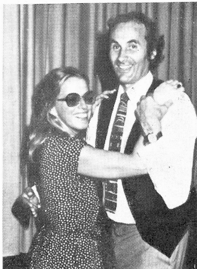
Encuentro de Gran Bretaña-Australia

Un folleto ilustrado con todos los discursos y alocuciones pronunciados en Porrentruy, puede obtenerse al precio de Fr. 10.— más gastos de franqueo, en el Secretariado de los Suizos del extranjero, Alpenstrasse 26, CH-3000 Berna 16, Suiza, mientras haya existencia.