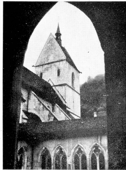
Convento de St-Ursanne