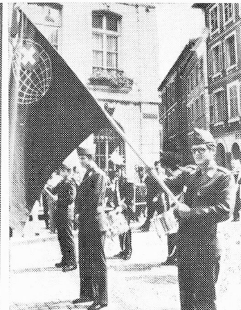
Parte del Desfile