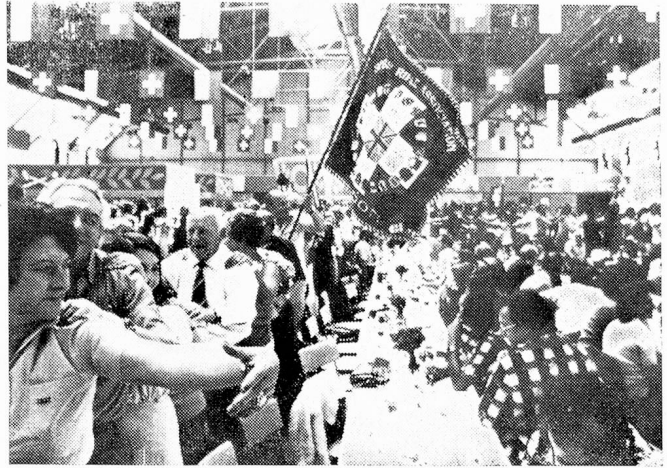
Se festejan los laureles y medallas!