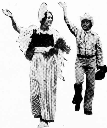
Holanda y Estados Unidos, una hermosa imagen de los Suizos del extranjero durante el Desfile oficial

¡Qué placer dar en el blanco, lo que prometía la conquista de