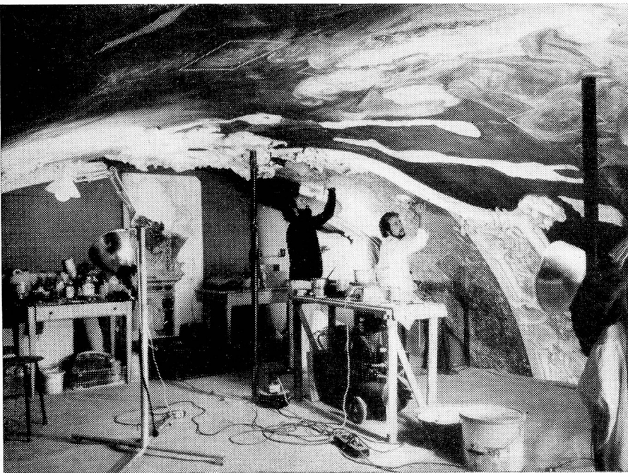
Especialistas trabajando en la Abadía de Einsiedeln (SZ)