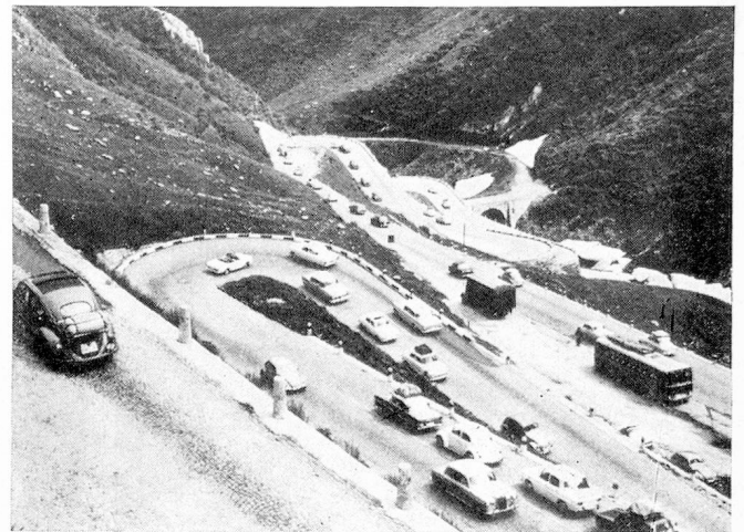
Arriba de Airolo, antes de la apertura del túnel

mente a los políticos, a los expertos de la planificación de la red caminera, y a los residentes aledaños, el hueco existente entre Varenzo (poco después de Airolo) y Gorduno (antes de Bellinzona) donde, en parte, el tráfico del Gotardo tendrá que sufrir, por años todavía, los inconvenientes de la angosta y sinuosa ruta cantonal de la Leventina. Es, sobre todo, el tráfico pesado que se desea limitar me-