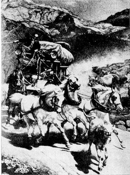
La diligencia del Gothardo en 1873, según un cuadro de Rudolf Koller

Desde el 5 de septiembre de 1980 el Cantón de Tesino solamente está a 15 minutos en automóvil del resto de Suiza. Ese día fue inaugurado el túnel carretero del Gotardo, luego de 11 años de trabajo. Una maravilla técnica cuya importancia trasciende nuestras fronteras.