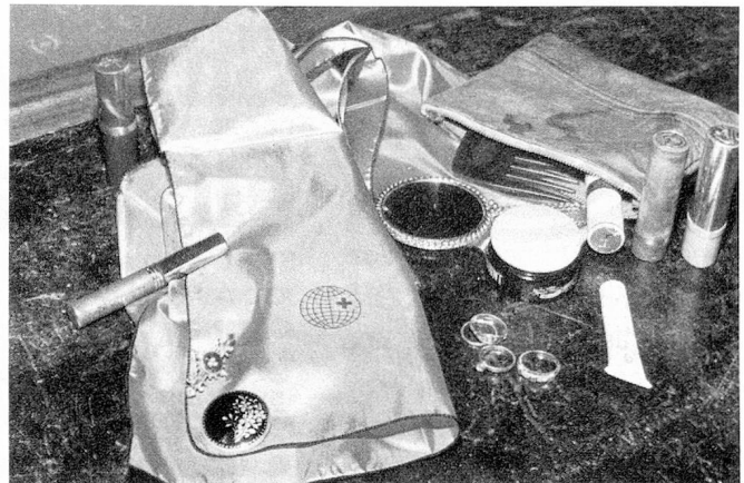
Pañuelo para el cuello , azul claro, pura seda, con la insignia de los suizos del extranjero. Precio Frs. 12.-