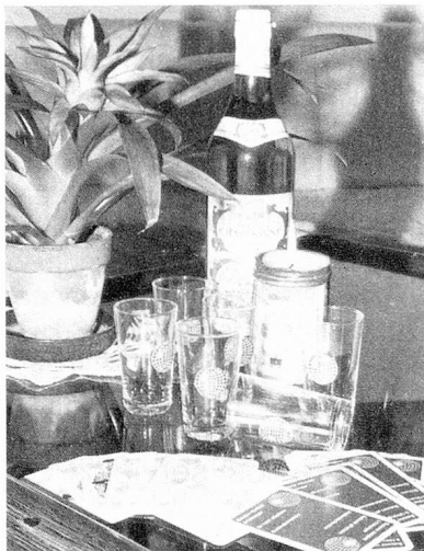
Vasos para Vino Blanco con la insignia. Cada uno Frs. 2.50.- 6 vasos Frs. 12.50.-