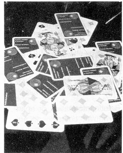
Juego de Naipes (Jass) francés y alemán. Dorso azul con insignia. Cada uno Frs. 4.-