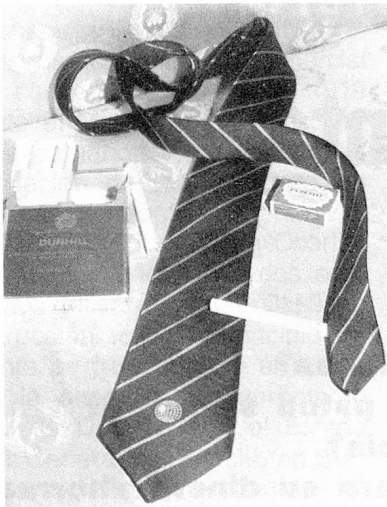
Corbatas rayadas, azul oscuro, pura seda, con la insignia de los suizos del extranjero. Precio Frs. 40.-