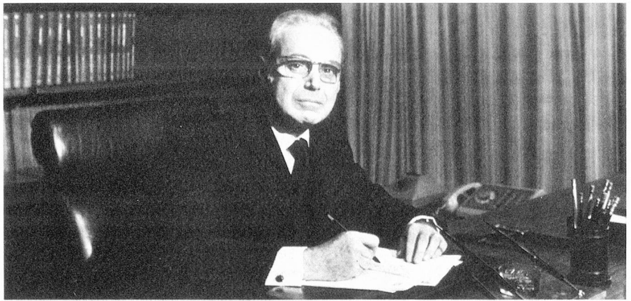
Javier Pérez de Cuéllar, Secretario General de la ONU

17 de Noviembre de 1971 Informe del Consejo federal sobre las relaciones de Suiza con la ONU y sus instituciones especializadas en los años 1969 a 1971 (segundo informe ONU). Las conclusiones hacen resaltar que el nivel de la evolución de la ONU hacia la universalidad es un elemento importante para apreciar nuestras relaciones con las Naciones Unidas y, en este contexto, para nuestra política de neutrali-