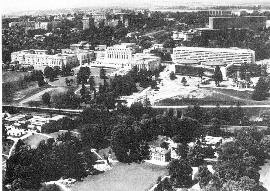
Sede de la ONU en Ginebra

pación en un número restringido de facetas elegidas si queremos realizar un trabajo eficaz a largo plazo. Es necesario tomar parte de una forma continua en los trabajos de las Naciones Unidas con el fin de poder seguir los problemas de principio a fin. También debemos estar en condiciones de reafirmar nuestros puntos de vista y de hacer progresar los conceptos a los que estamos arraigados. Es así que con nuestra ausencia voluntaria de la ONU nos arriesgamos a un aislamiento que solamente puede llegar a perjudicarnos. La razón nos recomienda por lo tanto participar activamente en la cooperación política, económica y social que se está desarrollando en el seno de la ONU. Podemos así poner fin a los inconvenientes resultantes del hecho que nuestra participación esté limitada en varios aspectos. Tendremos la posibilidad de defender mejor nuestros intereses y de presentar directamente nuestra política a la comunidad de los Estados. Esto cobra aún mayor importancia tomando en cuenta que una parti-