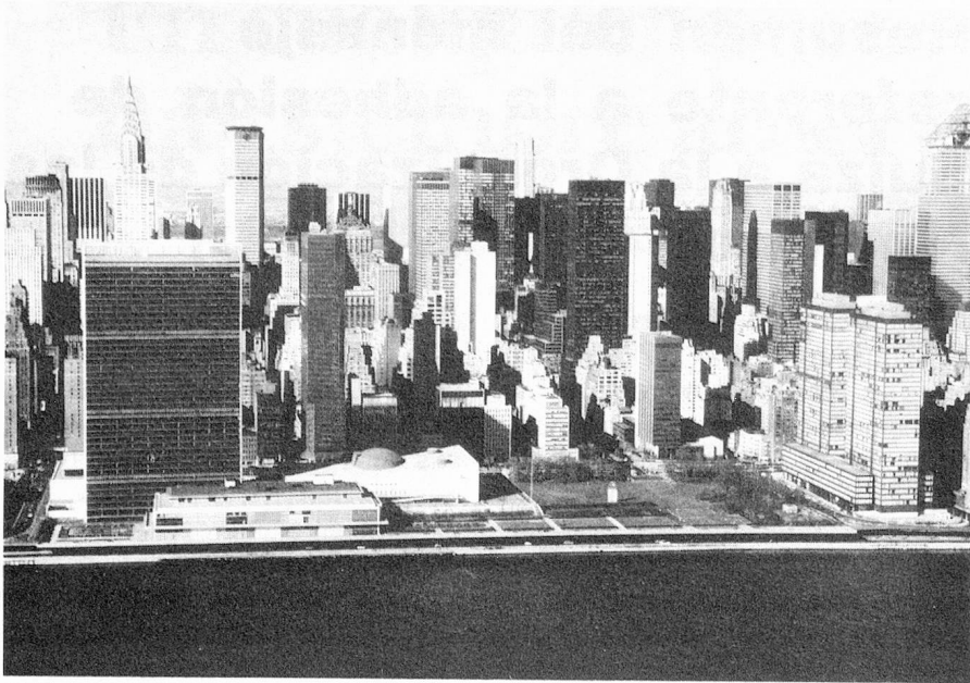
Edificio de la ONU en Nueva York

la índole de los conflictos lo que condujo a que la ONU concebiera nuevos métodos para mantener la paz tales como el envío de misiones de mediación y de observación y contingentes de cascos azules. La ONU creó así, sobre una base voluntaria, un instrumento capaz de crear las condiciones previas a una solución pacífica o de contribuir a la búsqueda de tal solución.