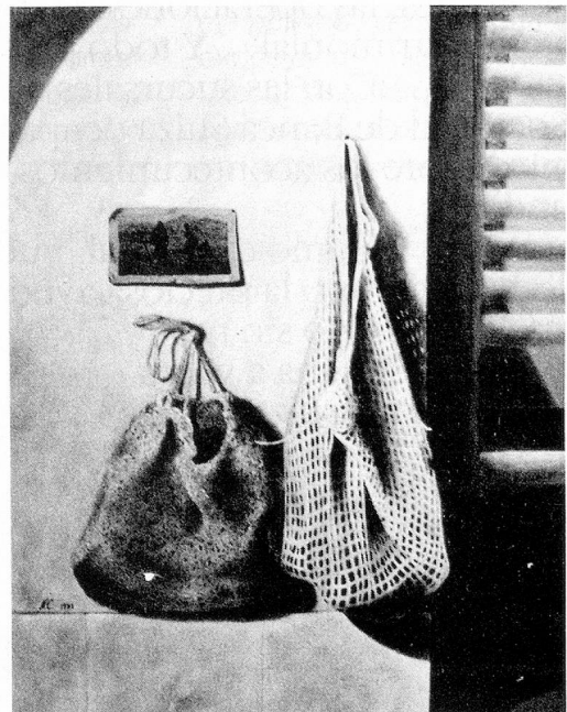
Norbert Clément «Angelus» (Perú)