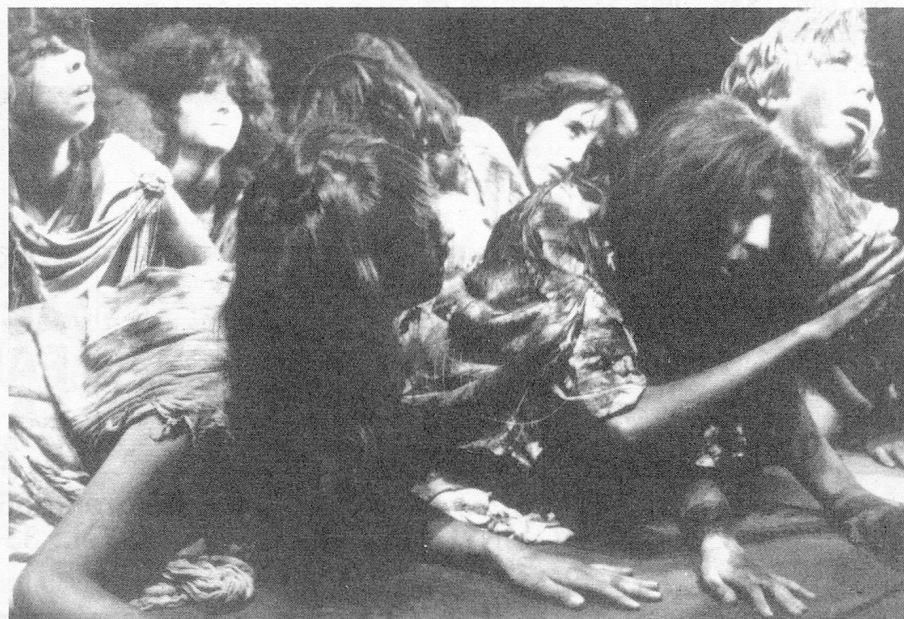
Una escena del filme «Mutación».