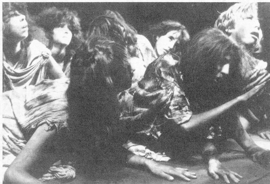
Una escena del filme «Mutación».