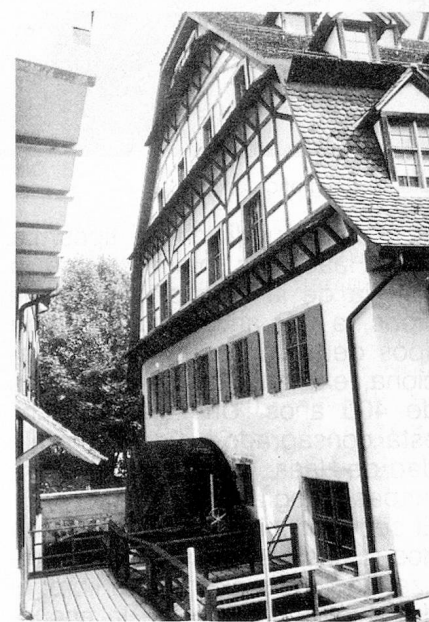
La rueda hidráulica del Molino de Papel, Basilea.

Una vieja escalera en el vestíbulo lleva al primer piso. Allí, en la sala orientada hacia el sur, uno encuentra una introducción compendiada a la historia de la escritura y del alfabeto, así como una exposición de las escrituras no alfabéticas. Los recintos ubicados en el este y norte, revelan al visitante las más antiguas escrituras alfabéticas semíticas, así como las griegas y romanas, y la fastuosa sala Galliciana, revestida de madera, las escrituras del medioevo. Una muestra de la evolución de la escritura hasta nuestros días, se presenta igualmente.