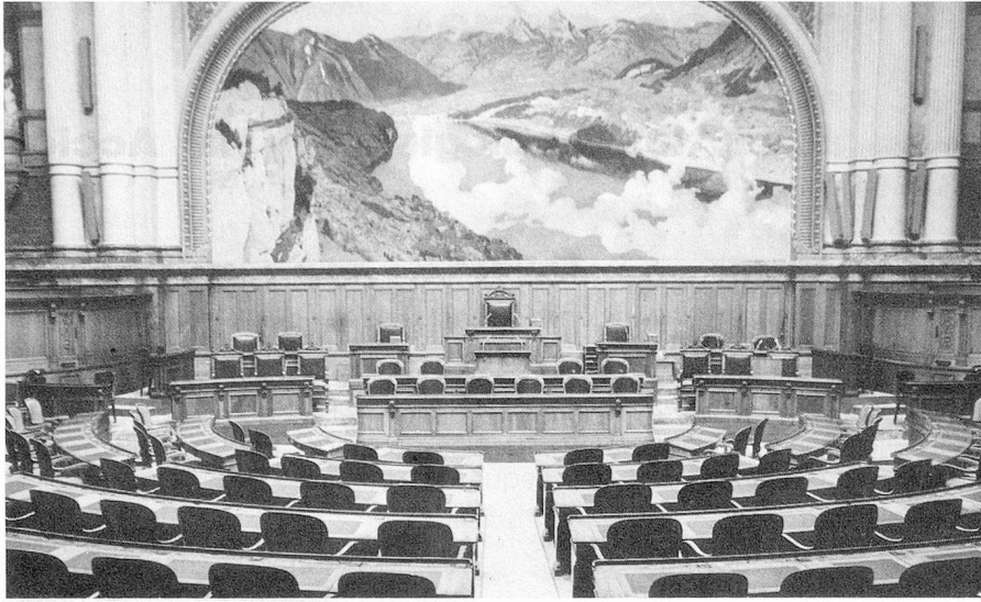
Sala del Consejo Nacional

estuvo tentado de hacer grupo común con la Alianza de los Independientes). Todos pertenecen al ala moderada del movimiento ecológico. Pueden entenderse entre sí. El verdadero vencedor de estas elecciones federales es el Partido Radical Suizo, es decir, la derecha. Registra una ganancia adicional de tres asientos en el Consejo de Estados y otros tantos en el Consejo Nacional. En la Suiza Romanda los radicales obtuvieron resultados brillantes. En Ginebra conquistaron con Robert Ducret el mandato del socialista Willi Donzé. En el Cantón de Vaud aumentó su delegación al Consejo Nacional, de cinco a siete. En el Jura son aún más fuertes y se ubican ahora en dos de los cuatro asientos del nuevo Cantón, en las Cámaras Federales: Gastón Brahier en el Consejo de Estados y Pierre Etique en el Consejo Nacional. Este es, por cierto, uno de los más grandes éxitos del 23 de octubre.