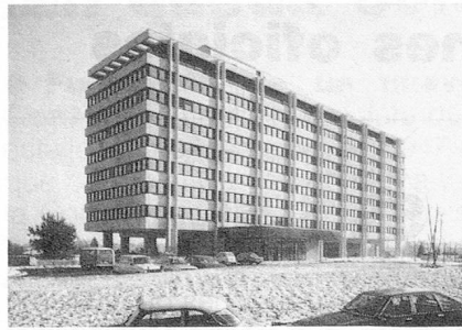
Caja de Compensación en Ginebra.

H.G. El nuevo sistema se aplica ya en alrededor del 50% de los casos. Admitimos excepciones allí donde la transferencia de divisas está sometida a fuertes restricciones y es posible efectuar una compensación entre los aportes y las rentas. Si es necesario nos esforzamos también para llegar a soluciones pragmáticas. Es así