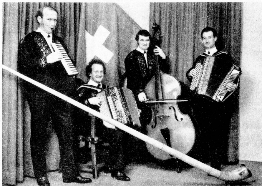
Conjunto folklórico suizo Käslin-Käslin, de Beckenried