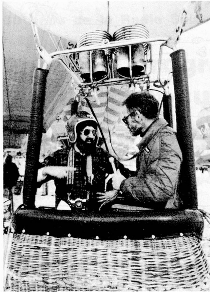
El servicio inglés en acción.

Un principio, el que fue definido en el informe del Consejo Federal