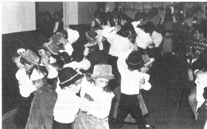
Recuerdo de la fiesta Suiza del 2 de Agosto de 1986 del Centro Social y Cultural Suizo de Reconquista, Prov. Santa Fe.

El sábado 2 de agosto, con asistencia de 272 personas y autoridades invitadas, el Centro de Residentes Suizos de Reconquista celebró la Fiesta Patria.