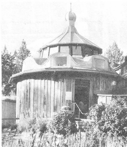
El Taller Segantini

Una de las obras más importantes de Giovanni Segantini (1858-1899) es el tríptico «La vida, la naturaleza y la muerte». Adquirida por la Fundación Gottfried Keller, de Zurich, se encuentra, desde 1908, en el Museo Segantini en Saint Moritz. Este tríptico fue un pedido hecho a Segantini para la Exposición Universal de 1900 en París. Con esta «sinfonía alpina, fiel reproducción de la naturaleza», ubicada en el Pabellón suizo, se esperaba promover el turismo naciente en la Alta Engadina. Pero razones financieras impidieron que ese ambicioso proyecto se realizara.