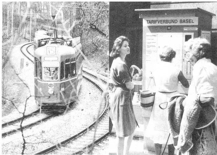
Comunidad tarifaria en Basilea: frente al tranvía, afluencia delante del expendedor automático de boletos.

Pero la idea ha anidado en otras ciudades suizas. Berna, Lucerna, Olten, Saint-Gallen, Soleure y Zurich, han puesto en circulación el