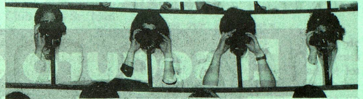
No solamente los futuros médicos deberían mirar de más cerca... (Estudiantes en el anfiteatro de patología de la Universidad de Berna).

Escuelas privadas en Suiza , lista de escuelas que forman