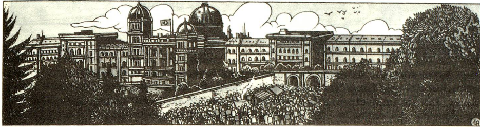
El Palacio Federal en Berna – visto en forma inédita... (en Lesueur, Christin, «Esperando la primavera»)

En el mes de junio, en Sierre, tendrá lugar la quinta edición de un festival de BD («Bande Dessinée – tira cómica») que tiene un éxito creciente. Es una ocasión para preguntarse de que manera los grandes nombres de los pequeños mickeys ven a nuestro país y lo ponen en tela de juicio.