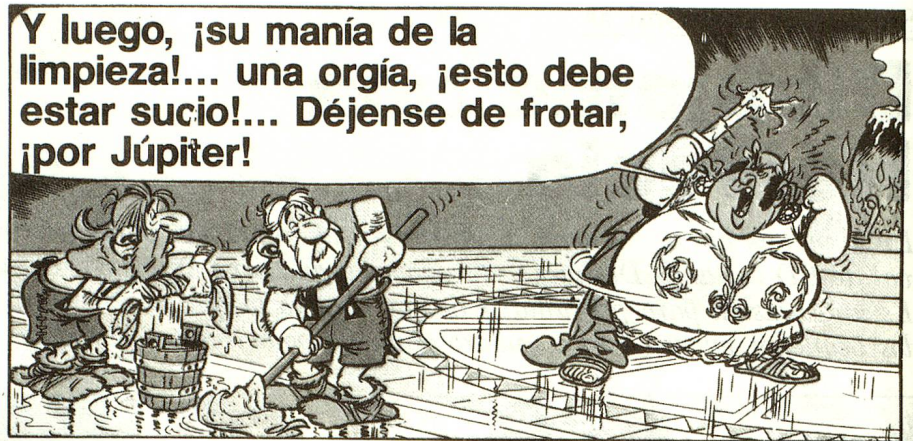
Los romanos tienen problemas con la fondue de queso y la pulcritud suíza (en «Asterix con los Helvéticos»)

¿porqué no? que el famoso Perceval o Parsifal venía en realidad del Valais, Hugo Pratt sumió a su héroe en un largo sueño charlatán y caótico sobre la búsqueda del Graal y de la eterna juventud. Publicado el año pasado por la revista «l'Ilustré», mismo a los fanáticos más entusiastas del gran dibujante veneciano, actualmente establecido en Grandvaux (VD), «Los Helvéticos» pareció interminable.