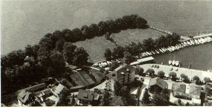
Plaza de los suizos del extranjero