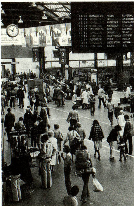
La puntualidad de los trenes suizos: un fenómeno asombroso para muchos extranjeros.

Esta mayoría no piensa ni un solo instante en la profusa afluencia en Suiza de miles de millones de dólares provenientes de otros países, particularmente países del tercer mundo. Aparte de esto, la chispa del antagonismo salta de tanto en