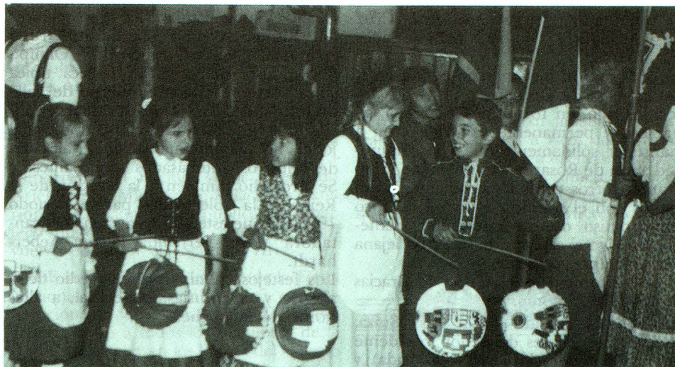
Niños ataviados con trajes típicos en el desfile de banderas y lampiones.