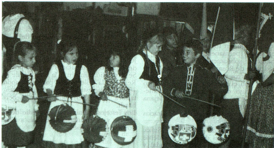
Niños ataviados con trajes típicos en el desfile de banderas y lampiones.