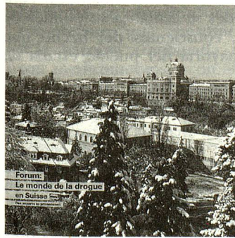
Imagen de un mundo intacto. Este decorado familiar esconde no obstante un problema que preocupa a los suizos más que los del medio ambiente y los pedidos de asilo: el número cada vez más creciente de toxicómanos.