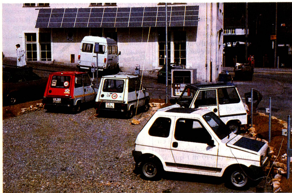
Los automóviles eléctricos cargan «sol» en Liestal.

«Actualmente la situación es casi inversa: