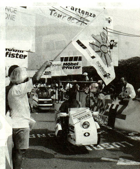
La carrera de automóviles solares «Vuelta del Sol», obra de pioneros de la energía solar en Suiza. (Foto: «Vuelta del Sol»).

● Ya el año pasado, una instalación solar de una potencia de 2,5 KW fue puesta en servicio en Titlis . Es la instalación solar más alta del mundo (2.540 m.) que alimenta la red. Sirve particularmente para estudiar el comportamiento de instalaciones solares en condiciones atmosféricas extremas.