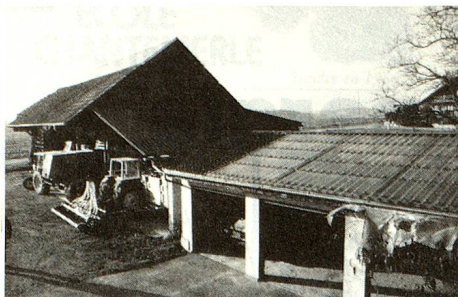
Utilización de la energía solar en la agricultura.