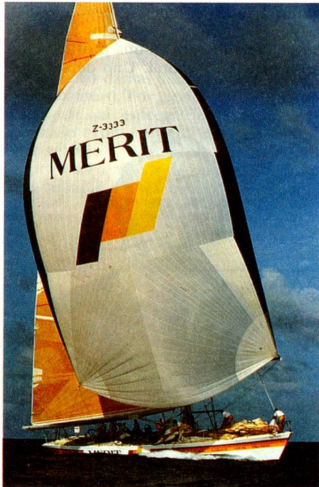
«Merit»: solamente los Ketches (dos palos) neozelandeses pudieron batirlo.

Club) en la próxima edición 1993/1994». Paralelamente, Pierre Fehlmann prepara el terreno para un desafío aún más fantástico: un barco suizo en la Copa de América que se disputará en 1992 en San Diego (California). Apoteosis de una carrera fuera de lo común pero que tendrá