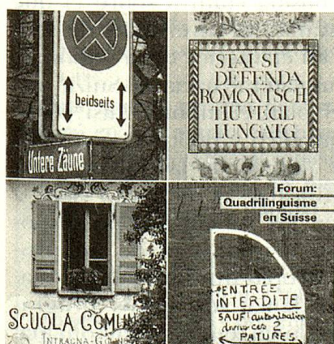
Es así como pueden manifestarse las cuatro lenguas nacionales.