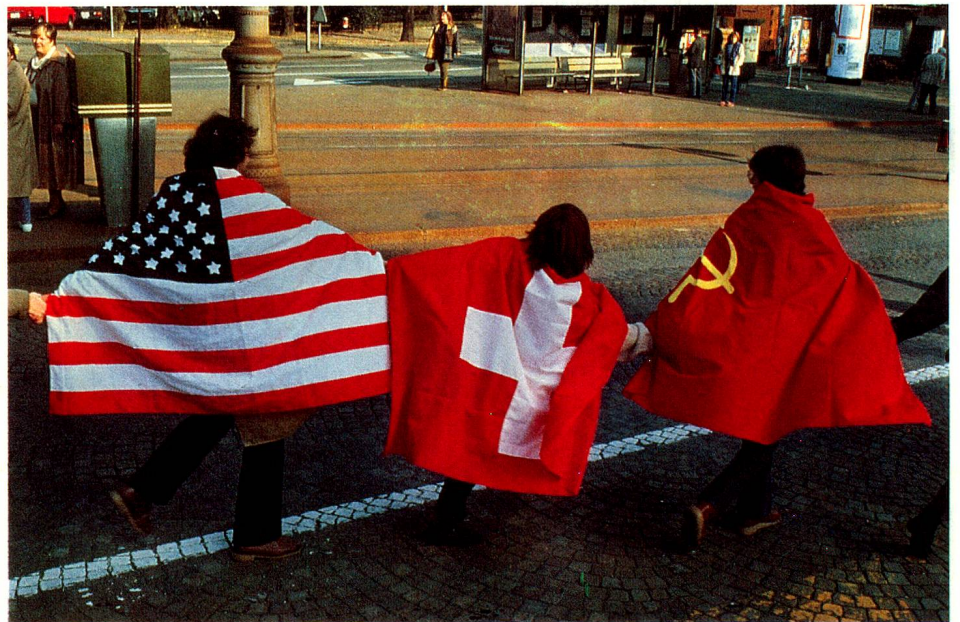
Este y Oeste se dan la mano.

Van desde la escuela primaria hasta las atracciones de una discoteca –prohibidas como consecuencia– pasando por la «escuela de hombres» (servicio militar). Los contrastes se suceden: después de la muerte, un tabú, es el baile de los oficiales, luego se ven los albergues donde están alojados los solicitantes de asilo e, inmediatamente después, niños jugando y niños enfermos. Bajo el título ambiguo de «El clima de Suiza» se encuentran, codo con codo, fotos que muestran una computadora en un establo y un desfile de modas, una fogata del 1º de agosto y la Feria de la Cebolla en Berna, así como una foto particularmente lograda de un coche tirado por caballos obligado a frenar bruscamente para dejar paso a un ve-