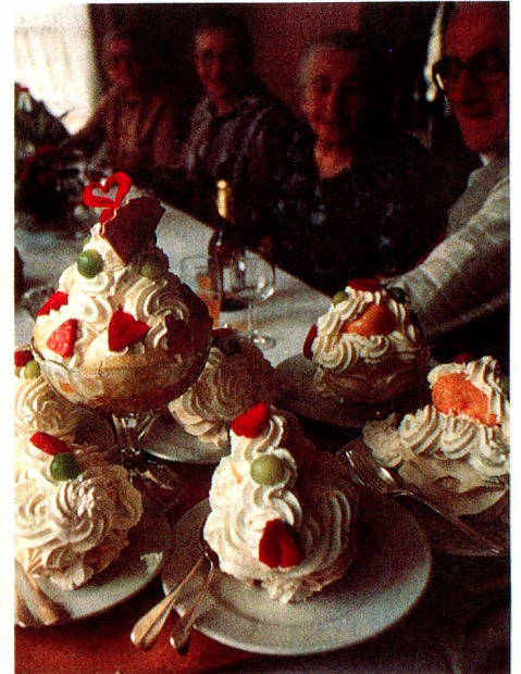
Postre clásico del Emmental

ejemplo el monumento a Tell en Altdorf, pero, al mirar más detenidamente, se nota que la atmósfera patriótica está sensiblemente perturbada por la presencia irrespetuosa, en primer plano, de alguien que esquite carozos de cerezas. La siguiente «combinación» es todavía más provocativa: un joven soldado en traje de