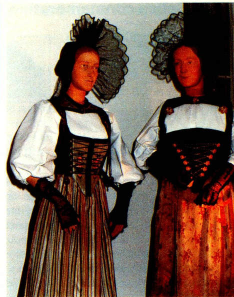
Unas cien figuras, algunas en tamaño natural, fueron confeccionadas para la Exposición Nacional de 1939.

Diversos instrumentos «más callados» nos recuerdan la música doméstica, como por ejemplo la cítara de Schwyz y de Glarus, la cítara de cuello del Emmental, Toggenburgo y