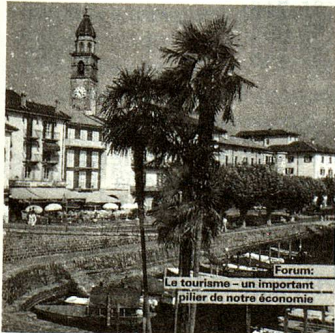
Ascona, antigua ciudad de pescadores enclavada al borde del lago Mayor y rodeada de palmeras, atrae gran número de turistas.