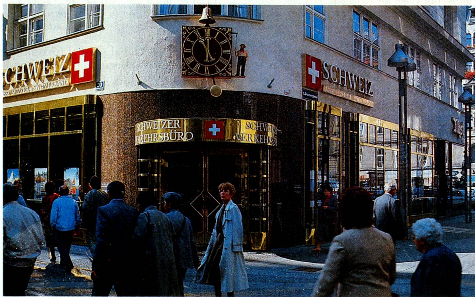
Oficina Suiza del Turismo en la Kärntnerstrasse, en Viena.