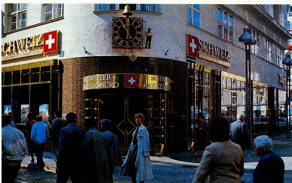
Oficina Suiza del Turismo en la Kärntnerstrasse, en Viena.