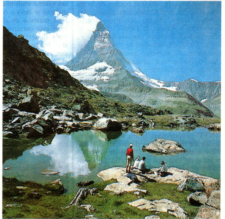
El Monte Cerviño como telón de fondo es nuestra mejor tarjeta de presentación

puede en muchos lugares ser mantenida más que por el hecho que el turismo procura al campesino una entrada complementaria. El futuro del turismo y la suerte de la agricultura de montaña esta-