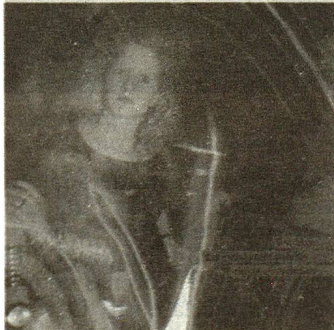
La discoteca a menudo desacreditada pero ampliamente frecuentada: la distracción por excelencia de los jóvenes de 14 a 20 años.