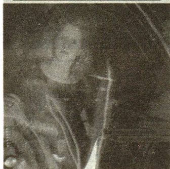
La discoteca a menudo desacreditada pero ampliamente frecuentada: la distracción por excelencia de los jóvenes de 14 a 20 años. (Foto: Michael von Grafenried).